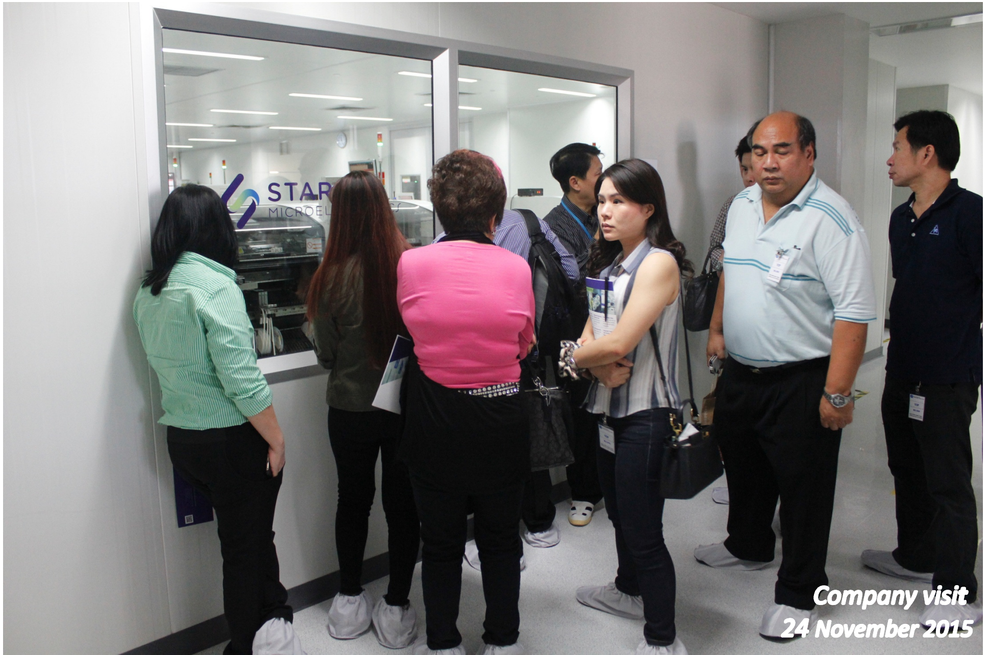
Company visit 24 November 2015