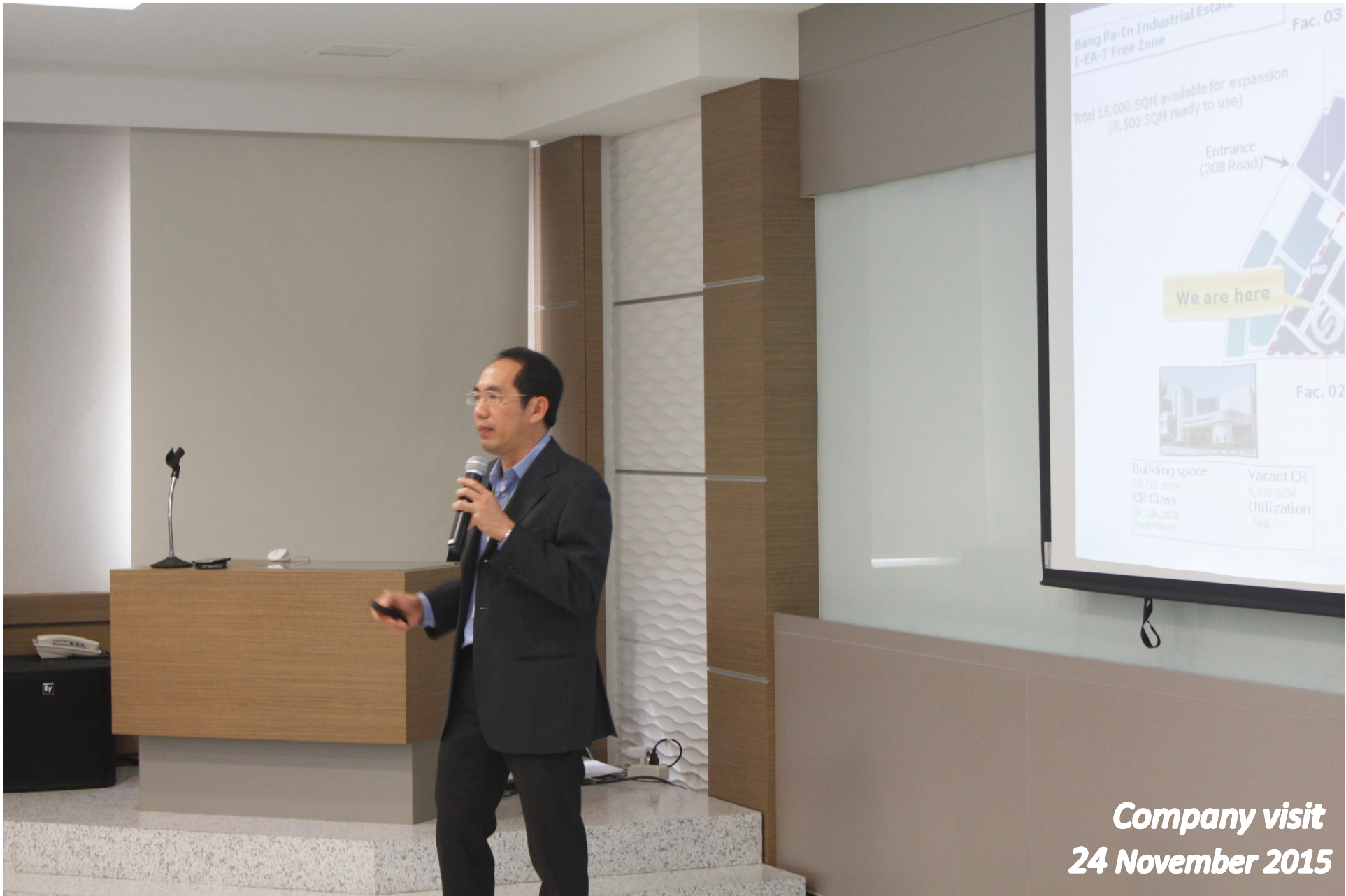
Company visit 24 November 2015