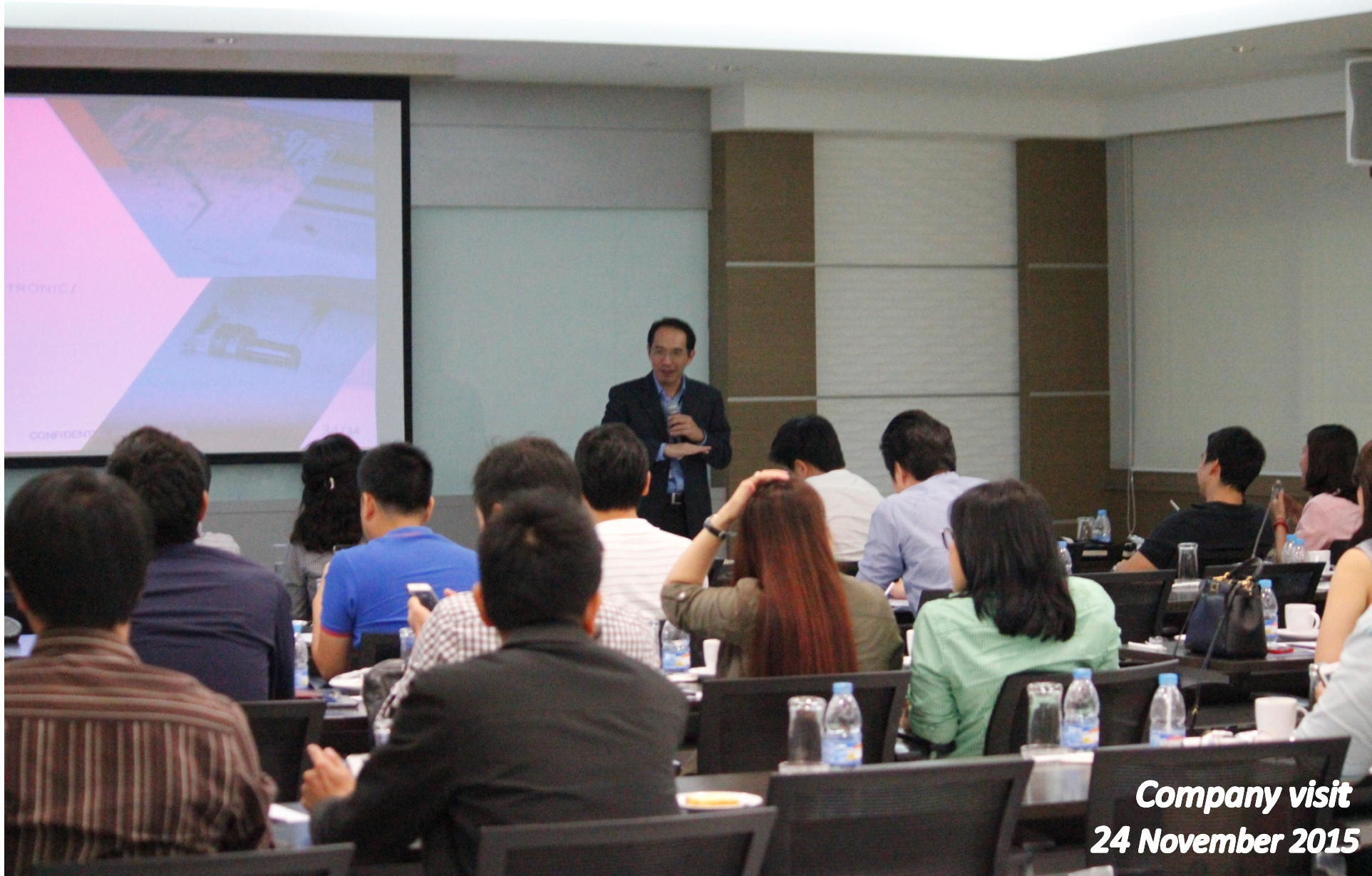
Company visit 24 November 2015