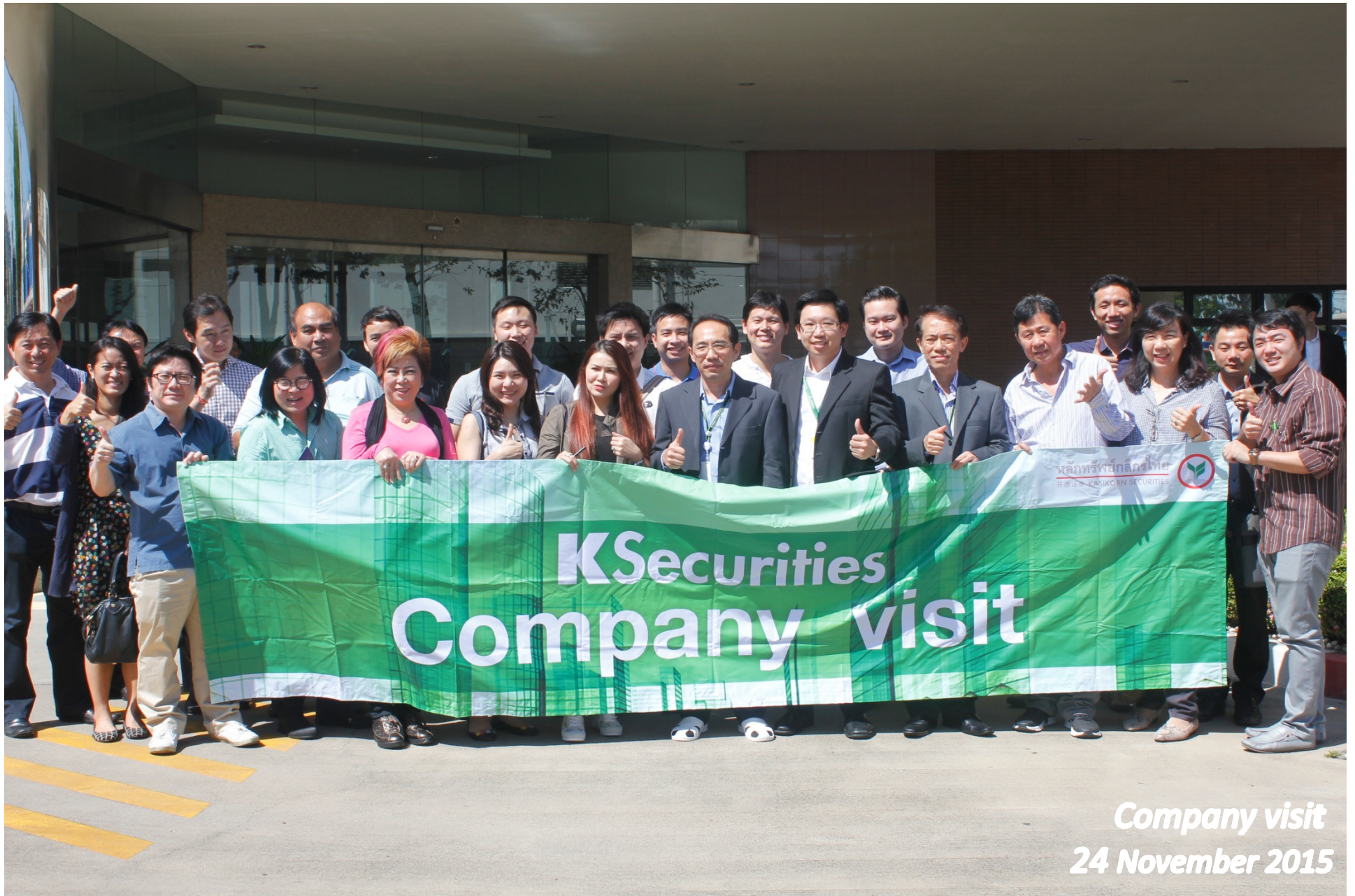
Company visit 24 November 2015