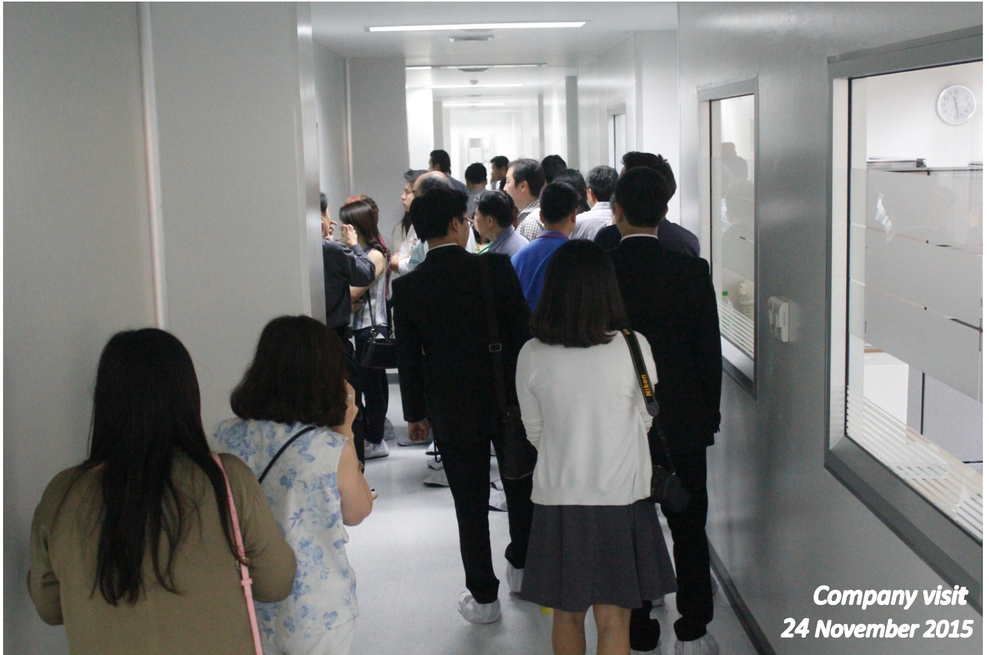
Company visit 24 November 2015