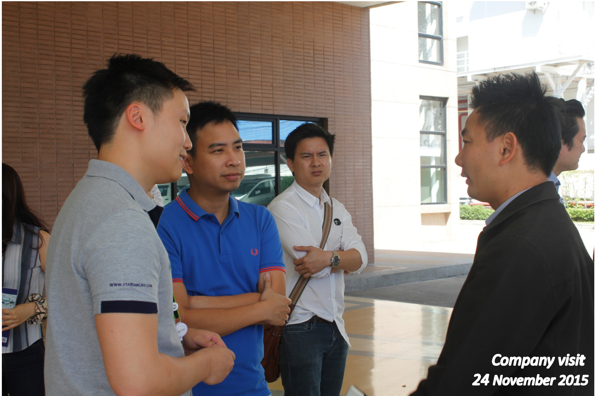
Company visit 24 November 2015