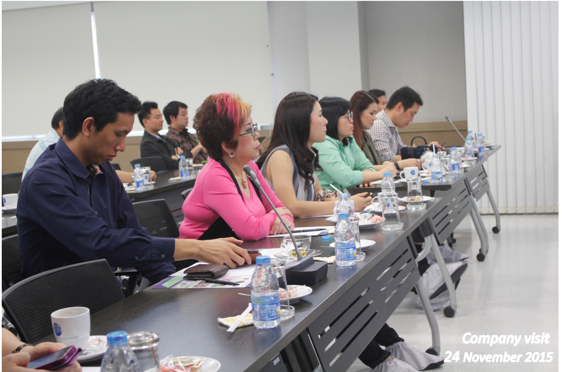
Company visit 24 November 2015