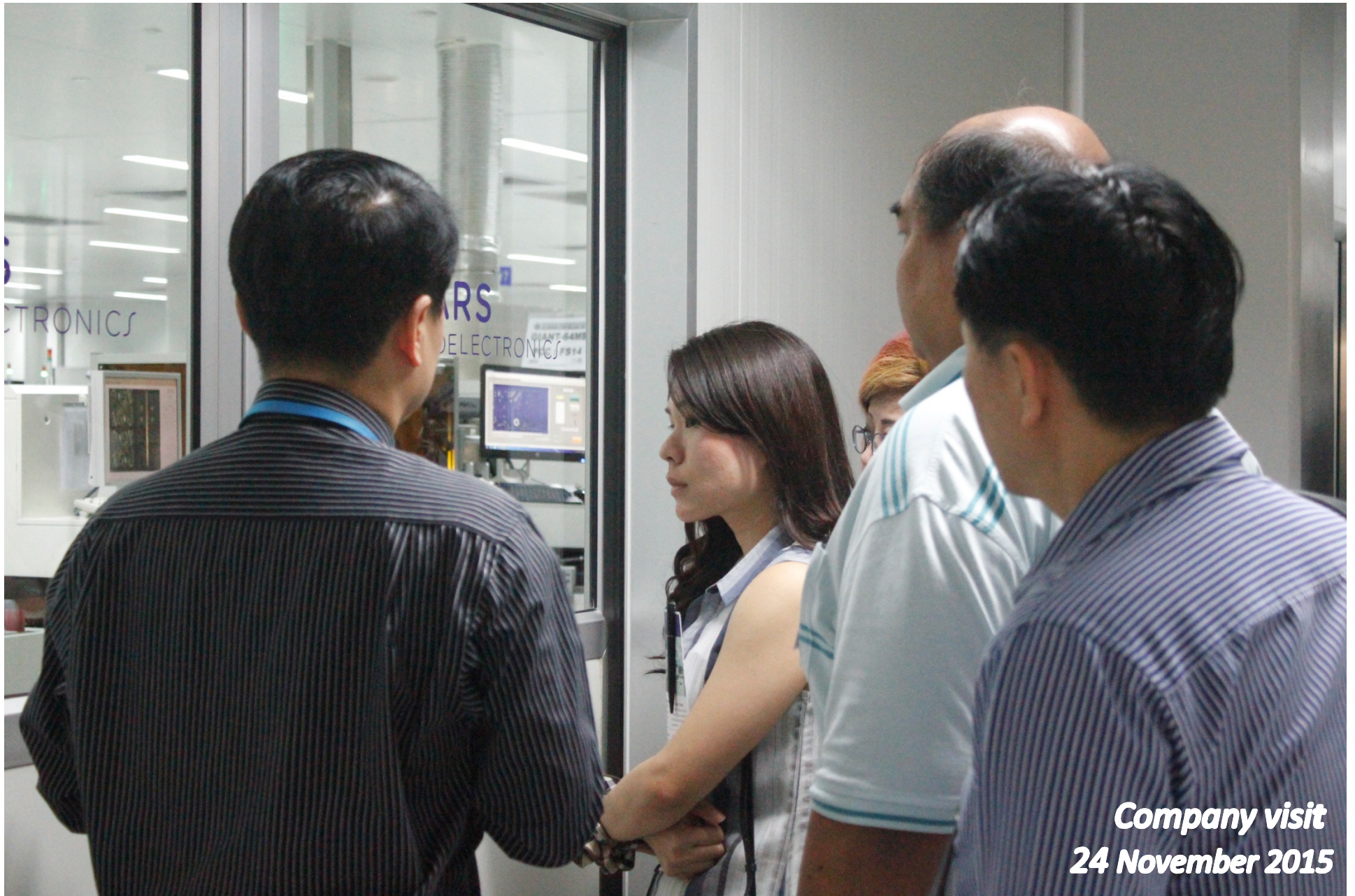
Company visit 24 November 2015