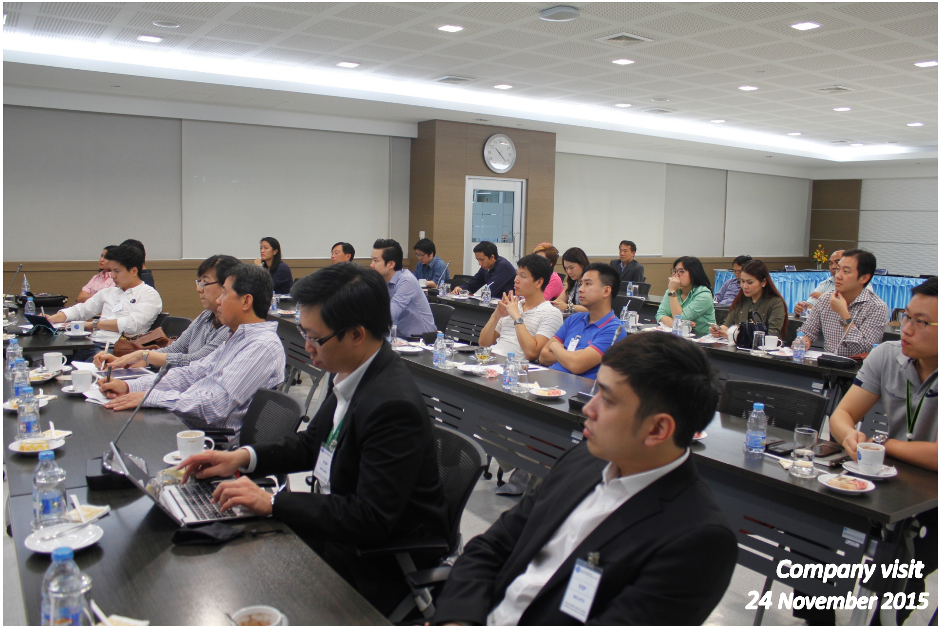
Company visit 24 November 2015